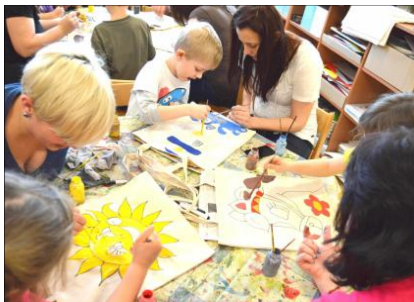
Foto: Výtvarné odpoledne v mateřské škole